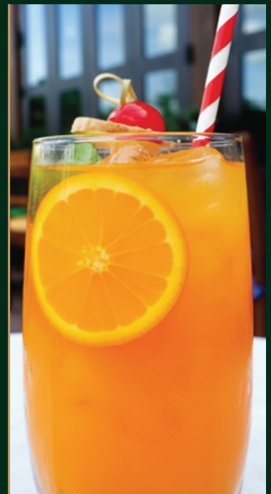
น้ำส้ม Orange juice 120 baht