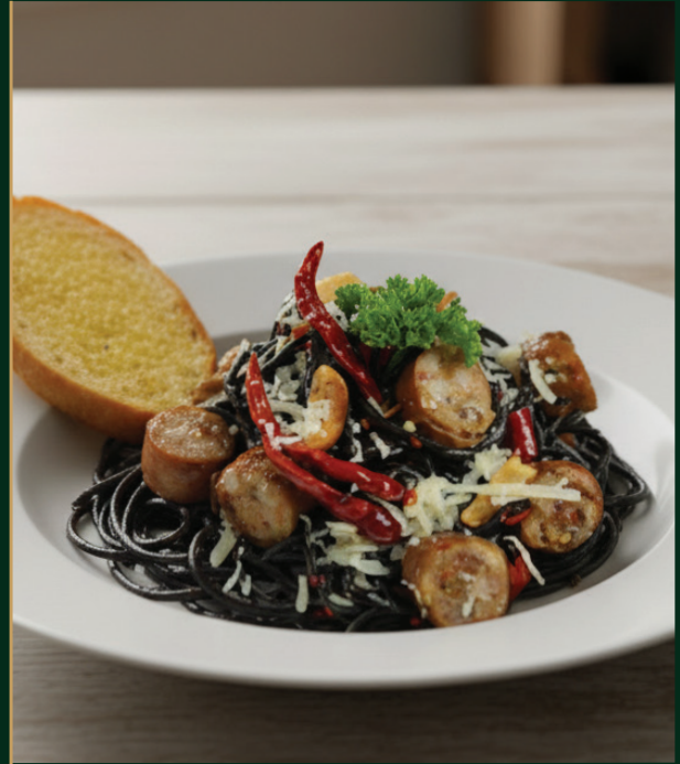
สปาเก็ตตี้เส้นดำใส่ฉั้ว Black spaghetti with chiang mai sausage 290 baht