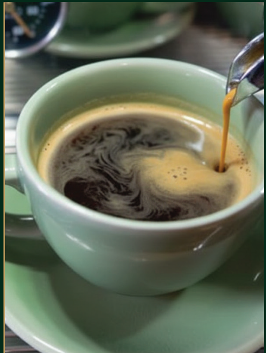
เอสเปรสโซ่ Espresso 120/140 baht