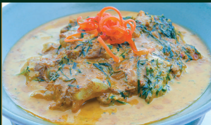
แกงคั่วกระต่ายอ่อนใบชะพลู Northern Spicy Minced Pork 300 baht