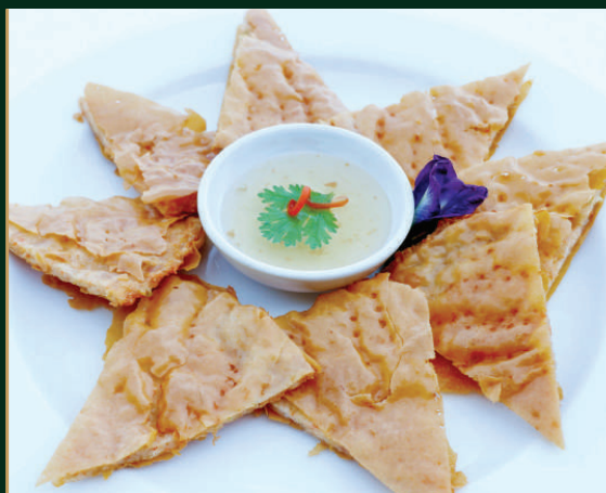
กุ้งกระเบื้อง Thai Crispy shrimp Pancakes 270 baht