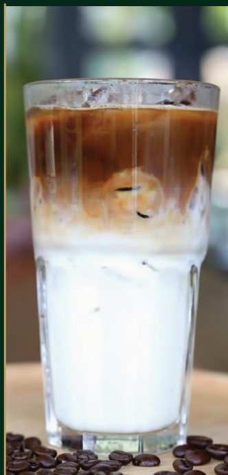
ลาเต้ Latte 120/140 baht