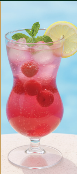
สตอว์เบอร์รี่โซดา Strawberry soda 120 baht