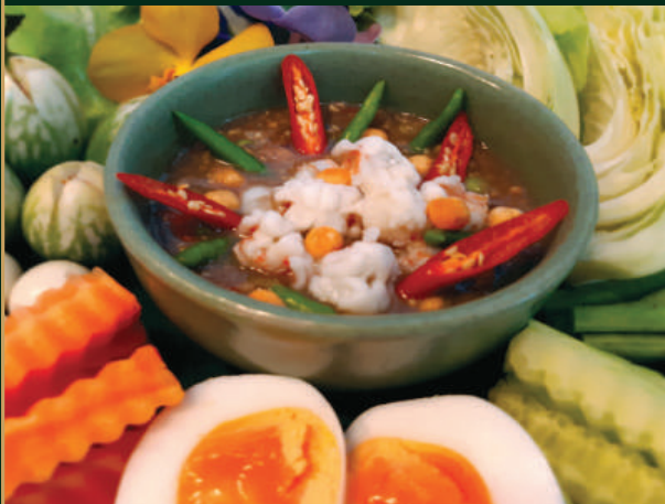
น้ำพริกกุ้งสด Shrimp Chili Dip 320 baht