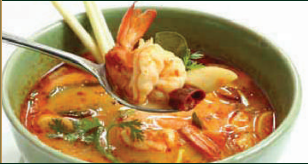
แกงส้มชะอมกุ้ง Sweet and sour soup with prawns 300 baht