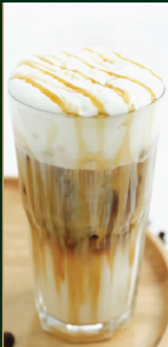
คาราเมล มัคคิอาโต้ Caramel macchiato 120/140 baht