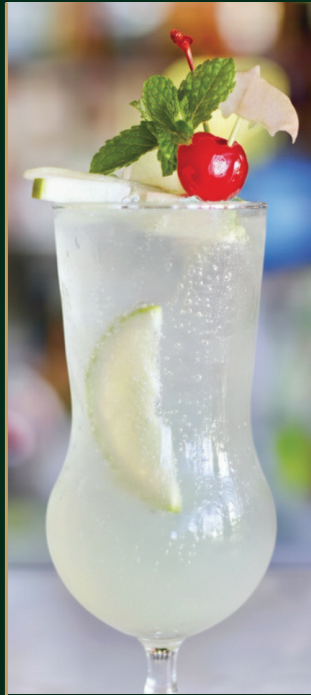
น้ำมะนาว Lemon juice 120 baht