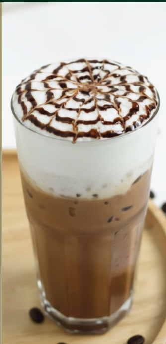
มอคค่า Mocha 120/140 baht