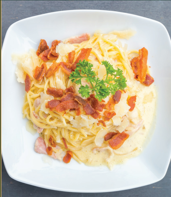
สปาเก็ตตี้คาโบนาร่า spaghetti carbonara 270 baht