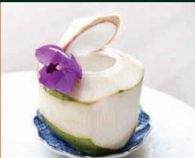
น้ำมะพร้าว Fresh coconut 140 baht