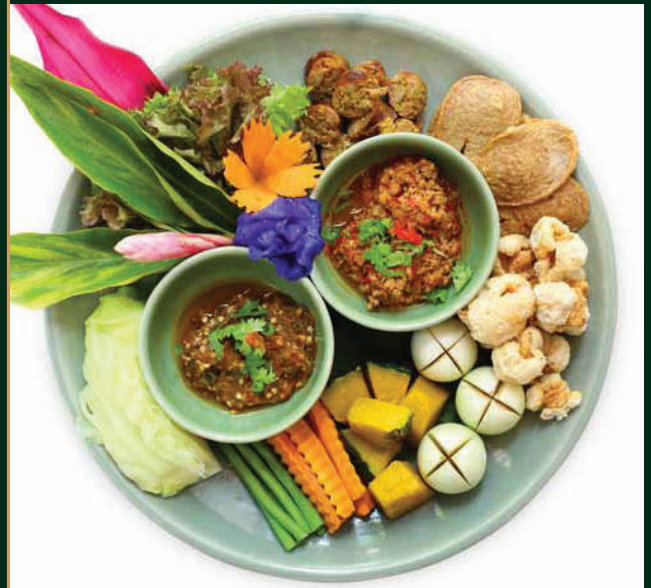
น้ำพริกกะปิ ปลาทุ Fried mackerel with shrimp paste dipping sauce 320 baht