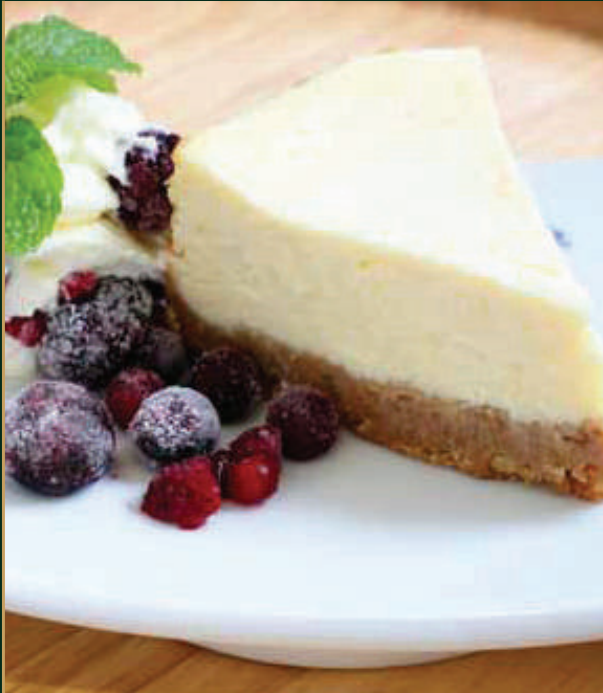
โฮมเมด ชีสเค้ก Homemade Cheese cake 120 baht