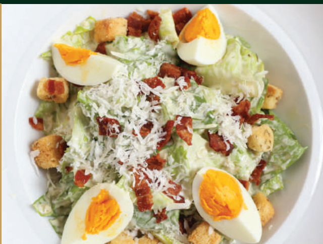
ซีซาร์สลัด