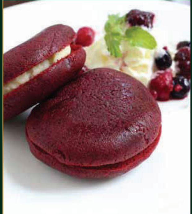
เรด เวลเวท Red velvet 120 baht