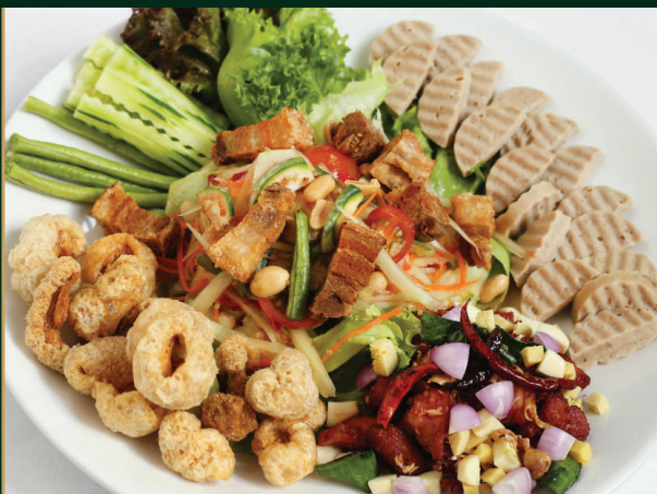
ส้มตำถาด

Thai Style Papaya Salad with sausage, Fried Fermented Pork Ribs