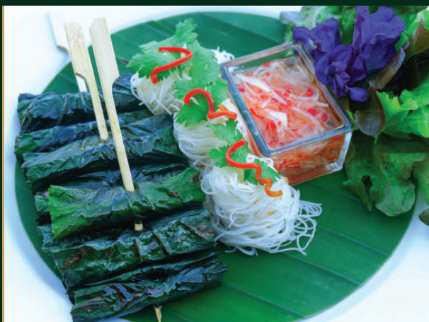
หมูย่างใบชะพลู Grilled Pork Wrapped In Wild Betel Leaf 190 baht