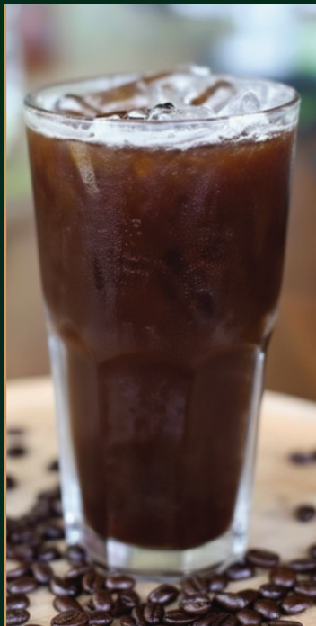
อเมริกาโน่ Americano 120/140 baht