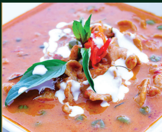
พะแนงหมูหรือเนื้อ Fried Spicy Pork Ball 250/300 baht