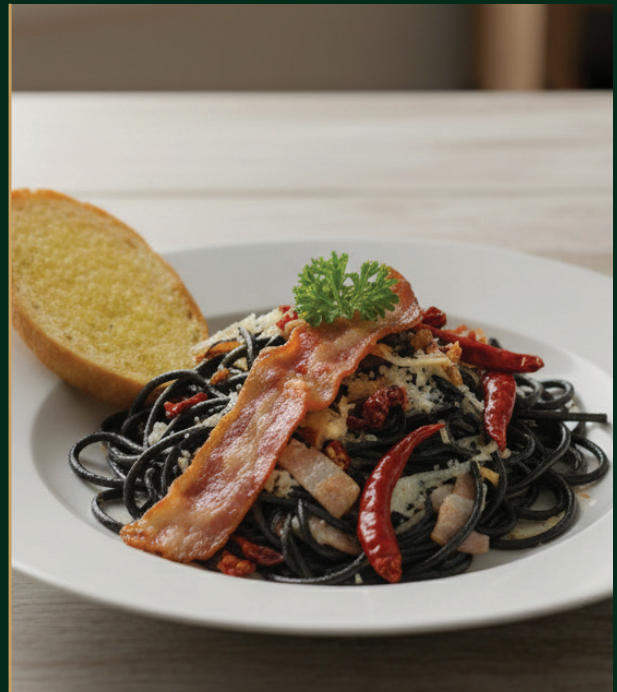
สปาเก็ตตี้เส้นดำเบคอน Black spaghetti with garlic and bacon 270 baht