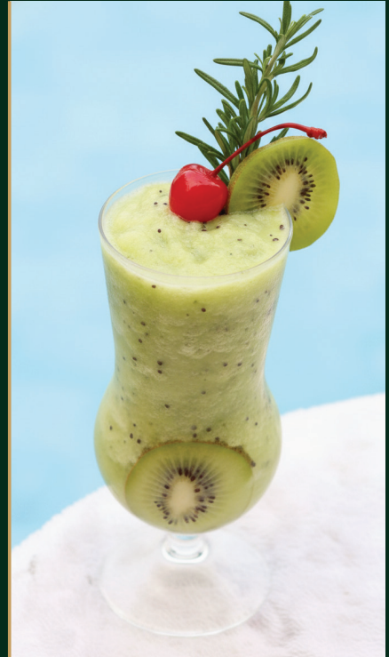
น้ำกีวี่ปั่น Kiwi shake 140 baht