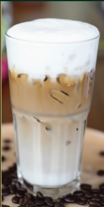
คาปูชิโน Cappuccino 120/140 baht