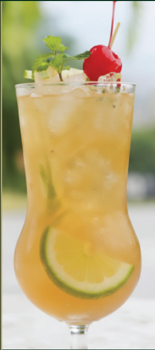
น้ำผึ้งมะนาว Honey lemon 120 baht