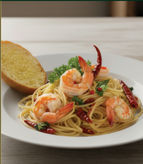
สปาเก็ตตี้พัดชีแมอิตาเลียน Spaghetti Italian style 270 baht