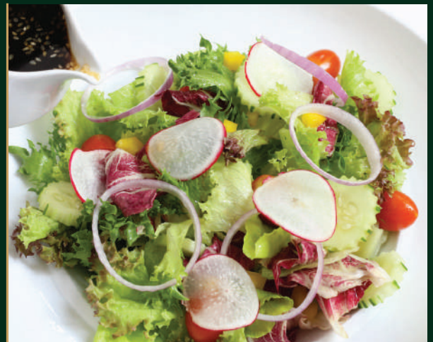
สลัดผักรวม