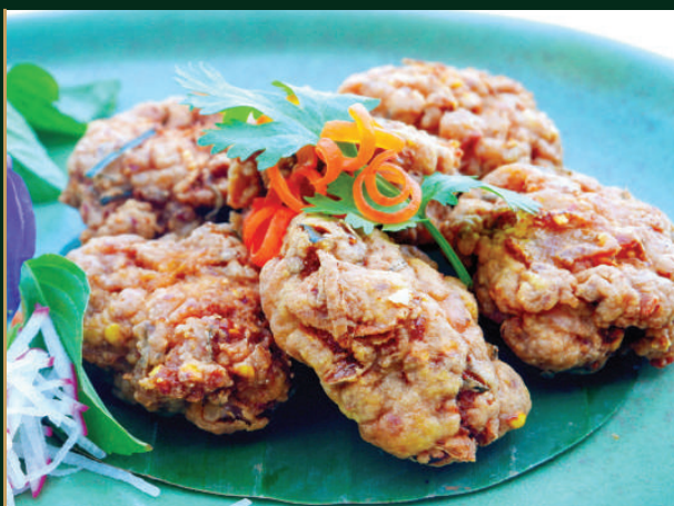
ลาบทูกอด Fried Spicy Pork Ball 250 baht