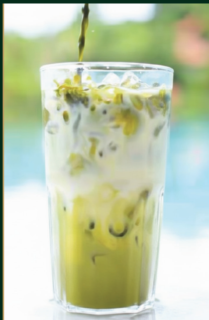
ชาเขียวนม Thai milk green tea 140 baht