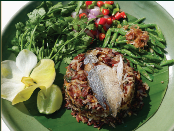
ข้าวผัดกะเพราปลาทุ

Rice topped with stir-fried mackerel and hot basil