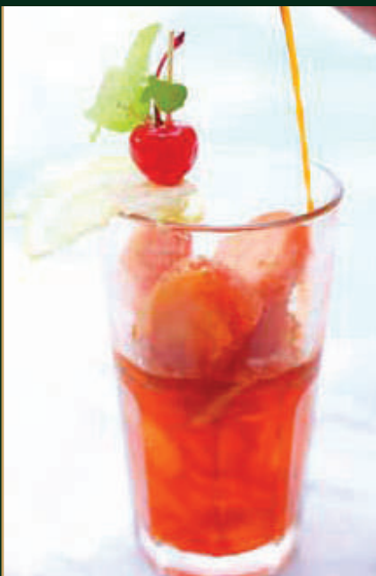
ชามะนาว Thai lemon ice tea 140 baht