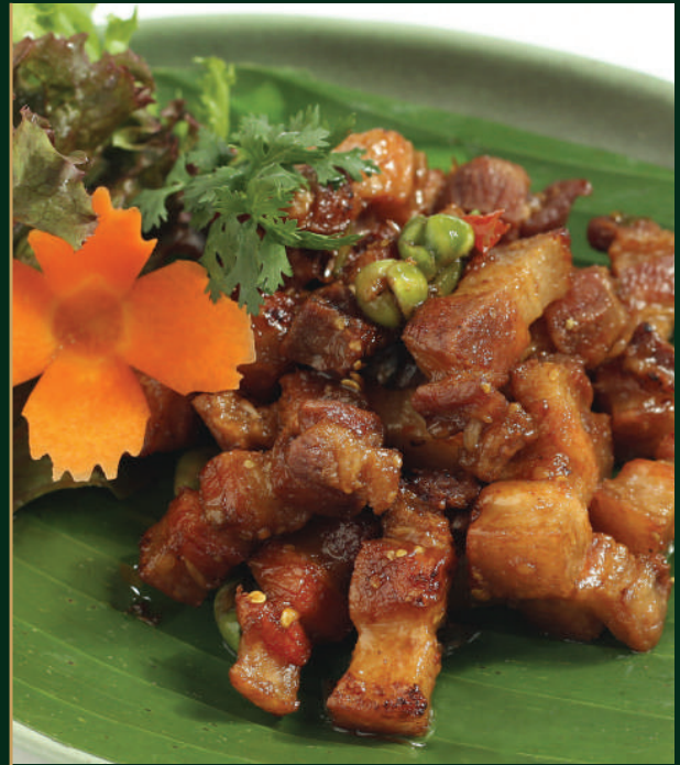
หมูผัดกะปิ Deep fried pork with shrimp paste 250 baht