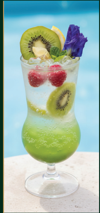
กีวี่โซดา Kiwi soda 120 baht