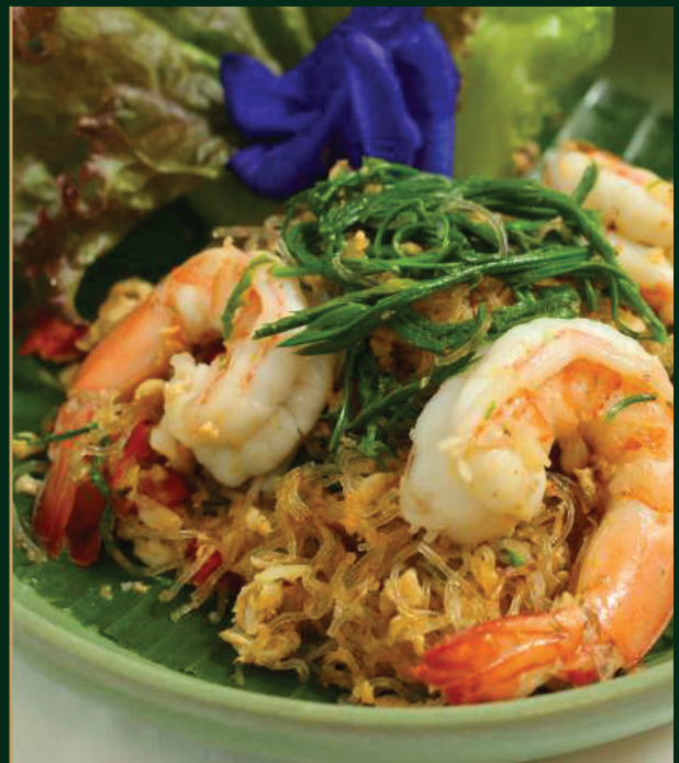
วุ้นเส้นผัดไข่ซอมกุ้งสด Thai fried vermicelli noodle with Climbing Wattle and prawn 280 baht