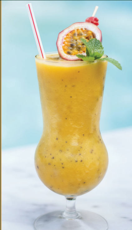
น้ำเสาวรสปั่น passion fruit shake 140 baht