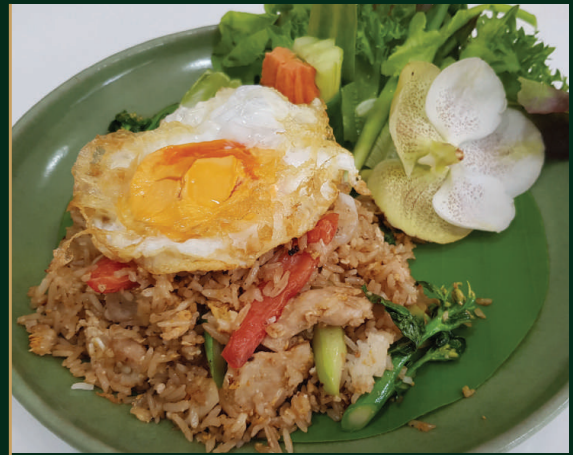
ข้าวผัดรถไฟหมู/กุ้ง

Fried rice with vegetable and pork or shrimp