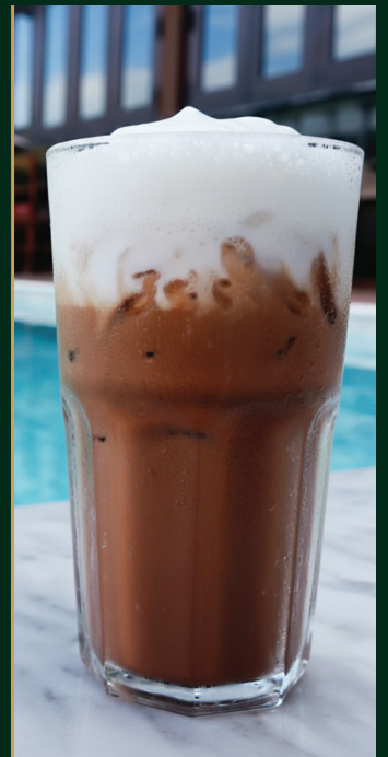
โกโก้ Cocoa 120/140 baht