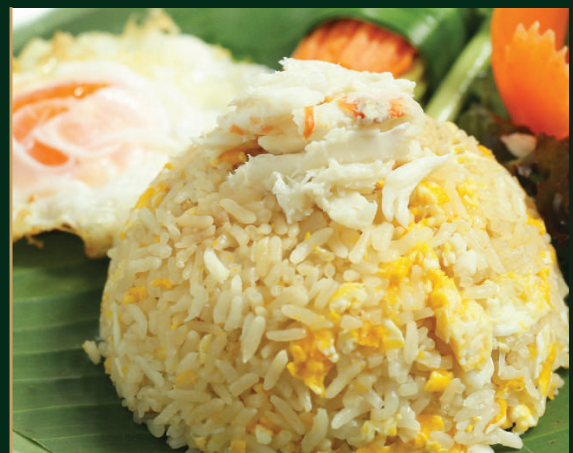
ข้าวผัดปูจันทราคีรี