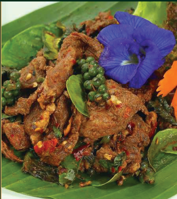
เนื้อผัดใบยี่หร่า Stir fried beef with fennel 420 baht