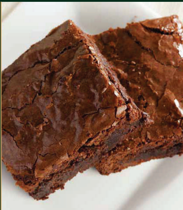
โฮมเมดบราวนี่ Homemade brownie 120 baht