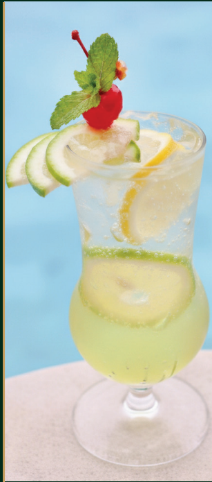
มะนาวโซดา Lemon soda 120 baht