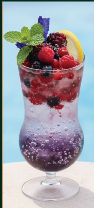
เบอร์รี่โซดา Berry soda 120 baht