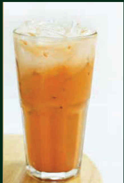
ชาไทยนม Thai milk tea 140 baht

All price are subject to 10% service charge & 7% vat