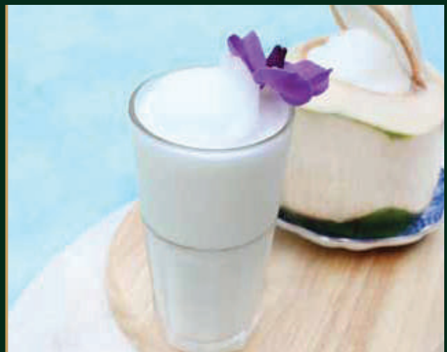
น้ำมะพร้าวรวมรส Fresh coconut with milk shake 140 baht

All price are subject to 10% service charge & 7% vat