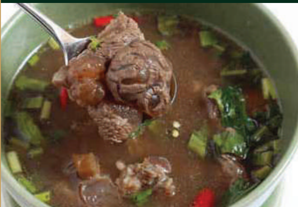
ต้มยำเนื้อตุ๋นหรือหมูตุ๋น Thai style spicy beef stew or pork stew 300/250 baht