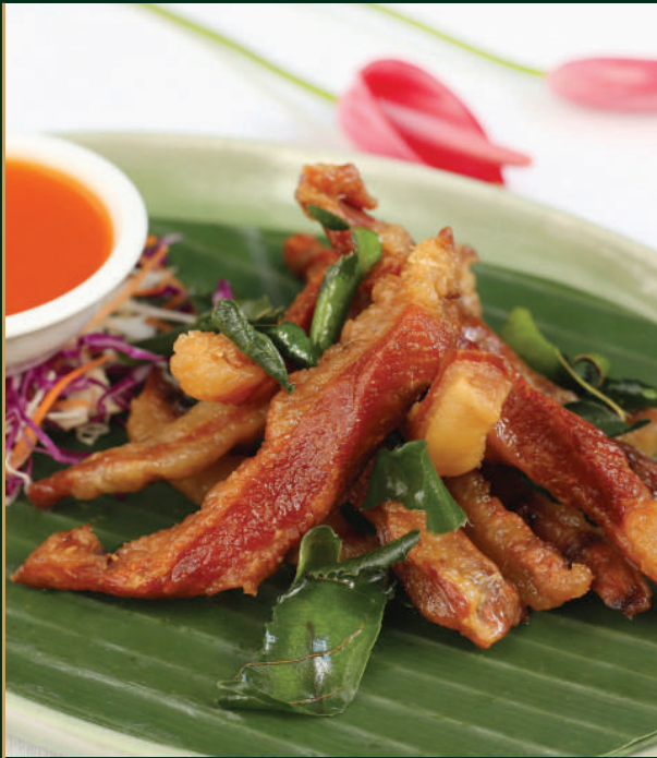
หมูแดดเดียว/เนื้อแดดเดียว Deep fried marinated pork/beef 240/290 baht