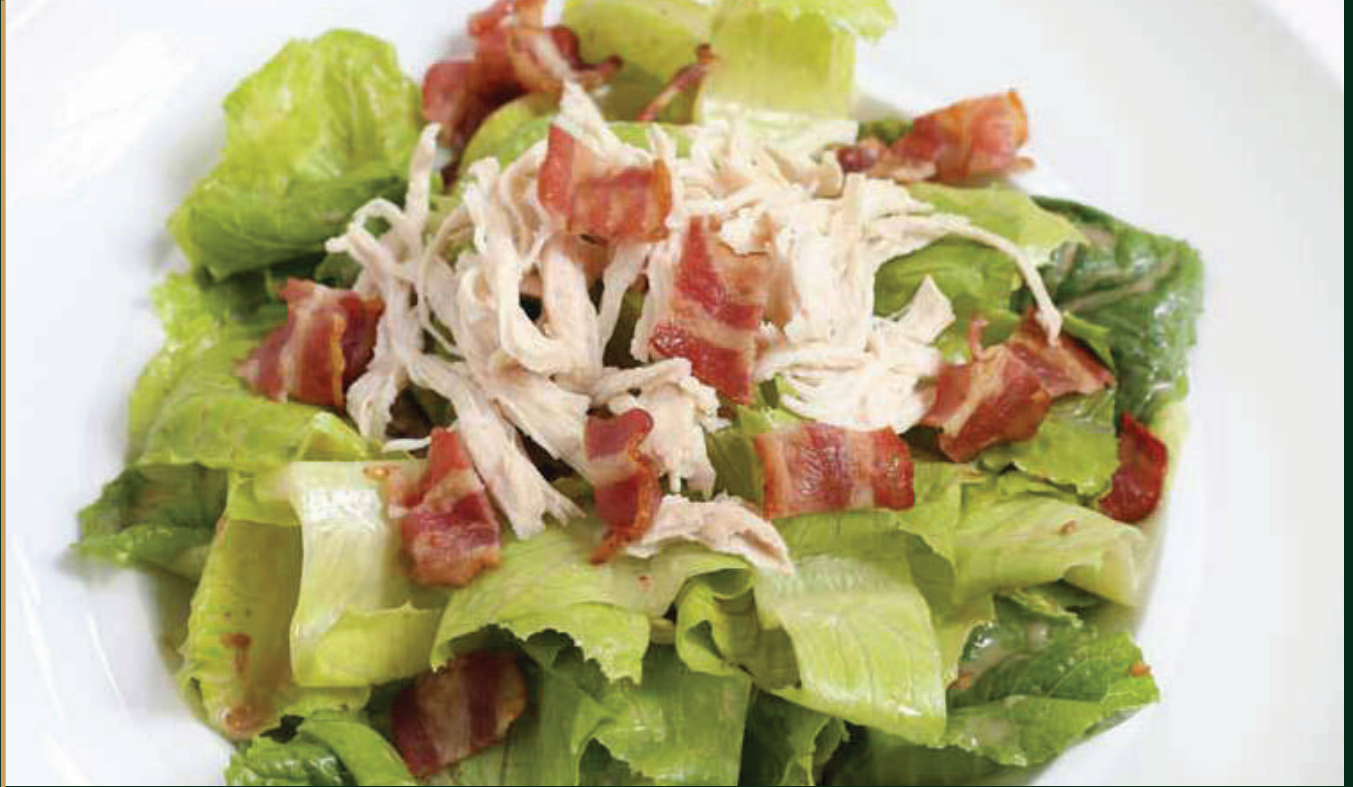
สลัดจันทราคีรี

Chantrakhiri salad served with special sauce