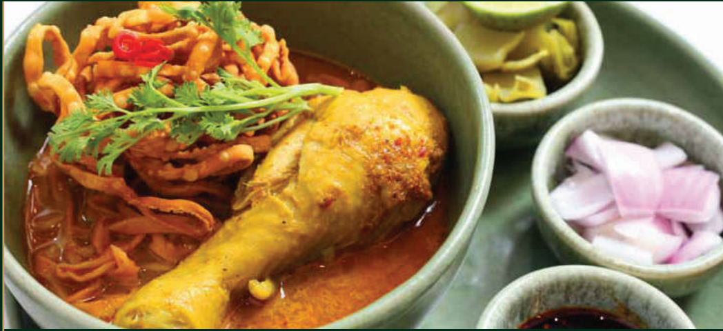
ข้าวซอยไก่หรือเนื้อ