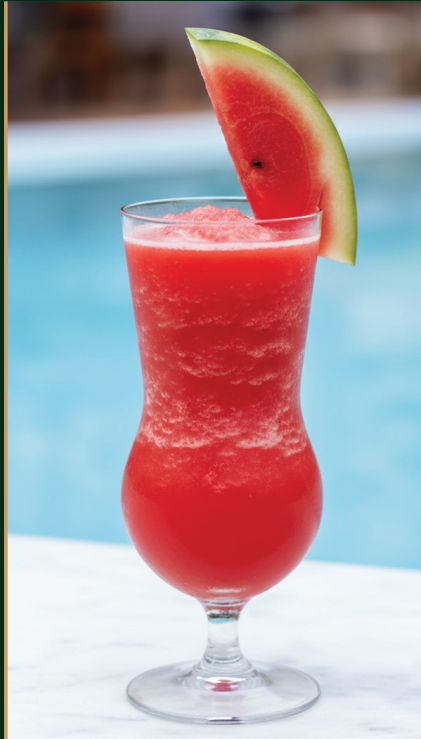
น้ำแตงโมปั่น Watermelon shake 140 baht