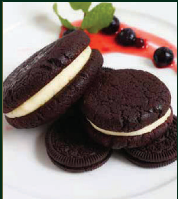
โอรีโอ ครีมชีส Oreo cream cheese 120 baht